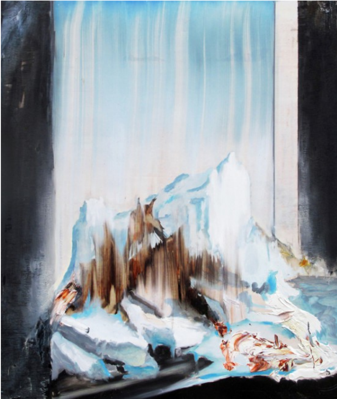
Thomas Falstad, Quest (2012). Olja på trä.