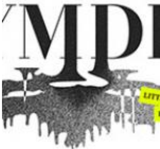
Veckan på Rymden