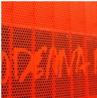
Konststaden Malmö: Ett rött skynke