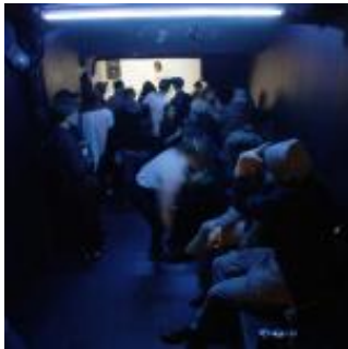
SPACE:TIME på Revenue